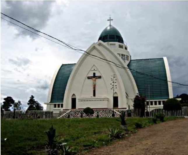
La Cattedrale di Bukavu