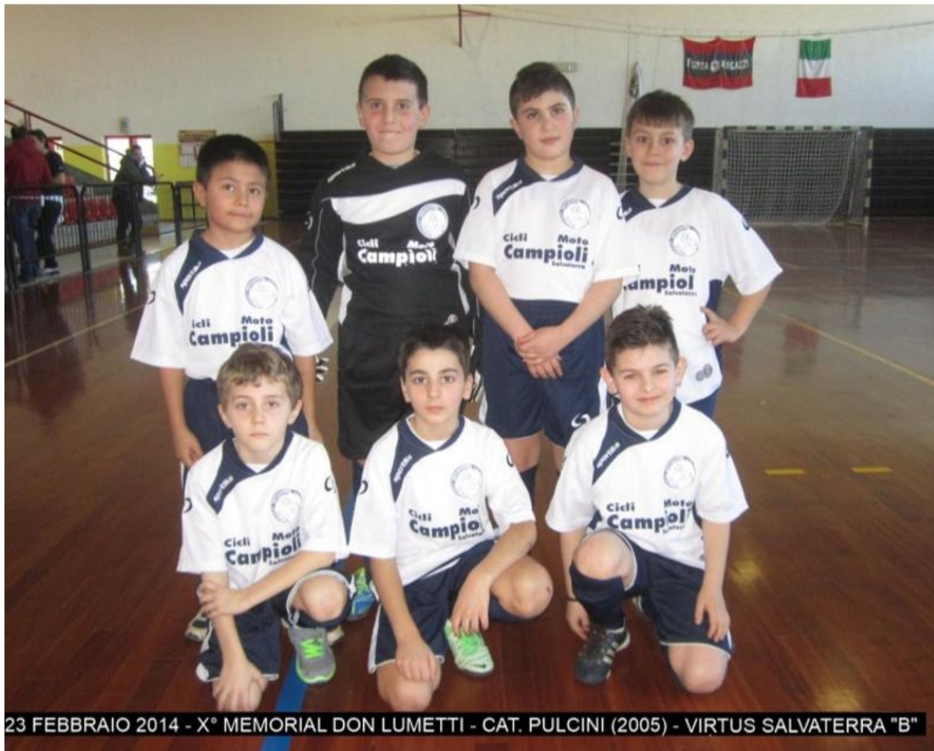
23 FEBBRAIO 2014 - X° MEMORIAL DON LUMETTI - CAT. PULCINI (2005) - VIRTUS SALVATERRA "B"