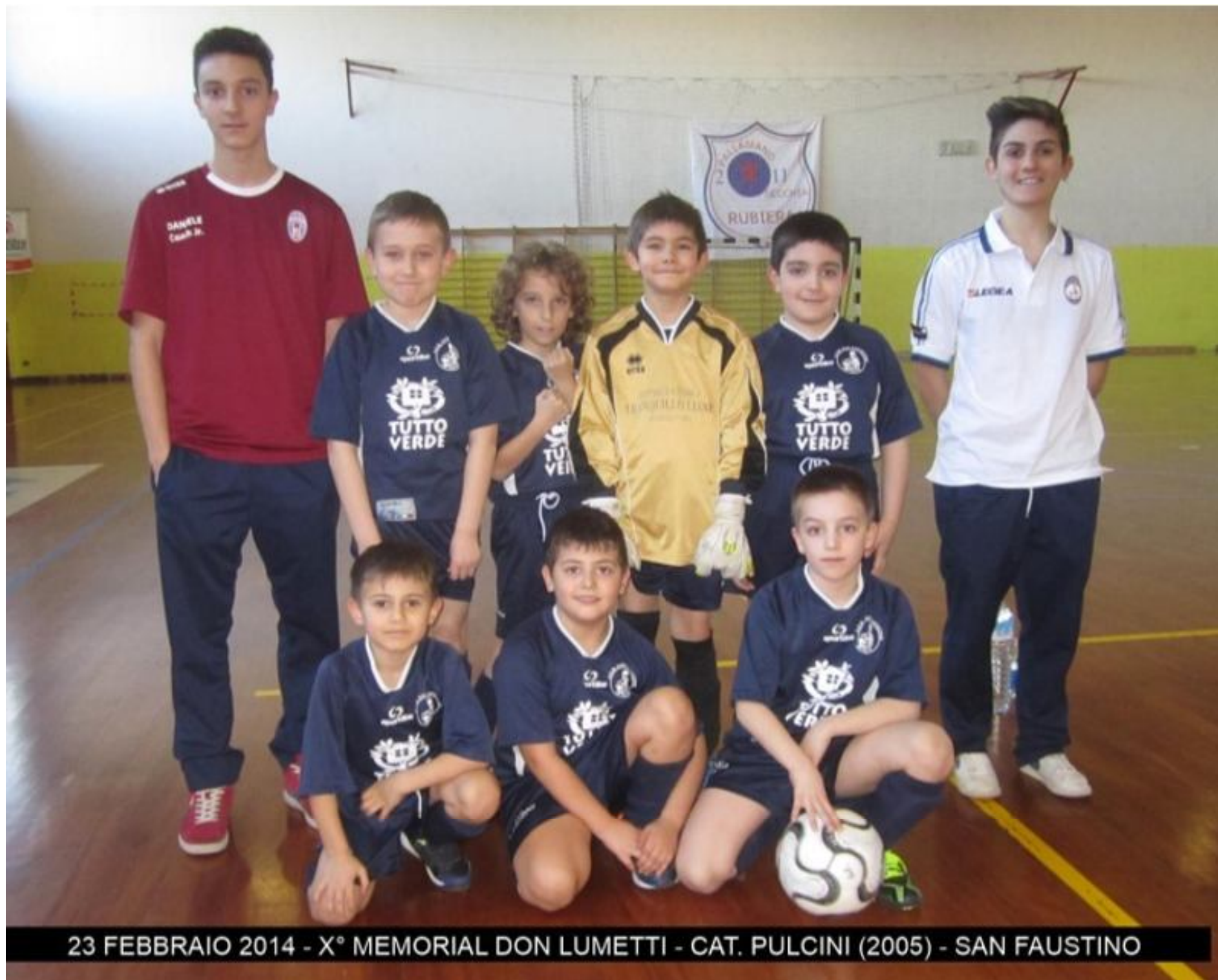
23 FEBBRAIO 2014 - X° MEMORIAL DON LUMETTI - CAT. PULCINI (2005) - SAN FAUSTINO