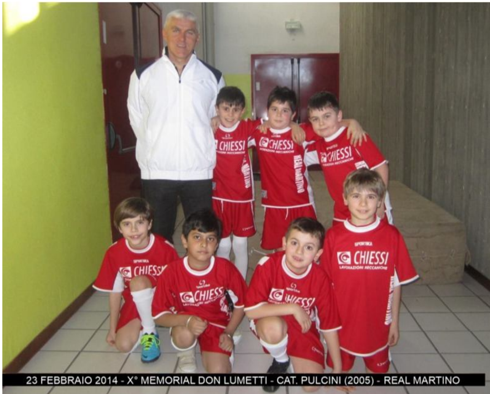
23 FEBBRAIO 2014 - X° MEMORIAL DON LUMETTI - CAT. PULCINI (2005) - REAL MARTINO