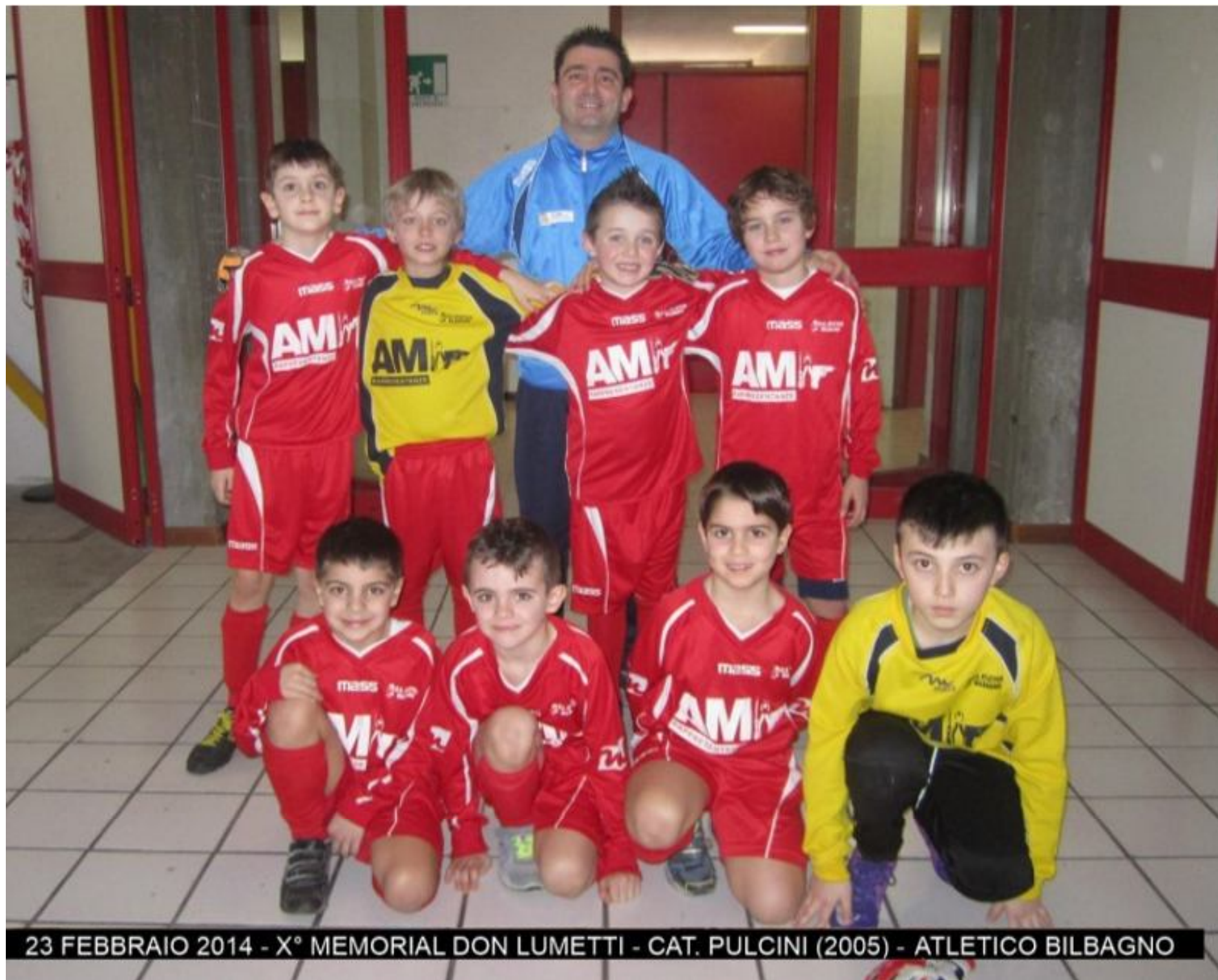
23 FEBBRAIO 2014 - X° MEMORIAL DON LUMETTI - CAT. PULCINI (2005) - ATLETICO BILBAGNO