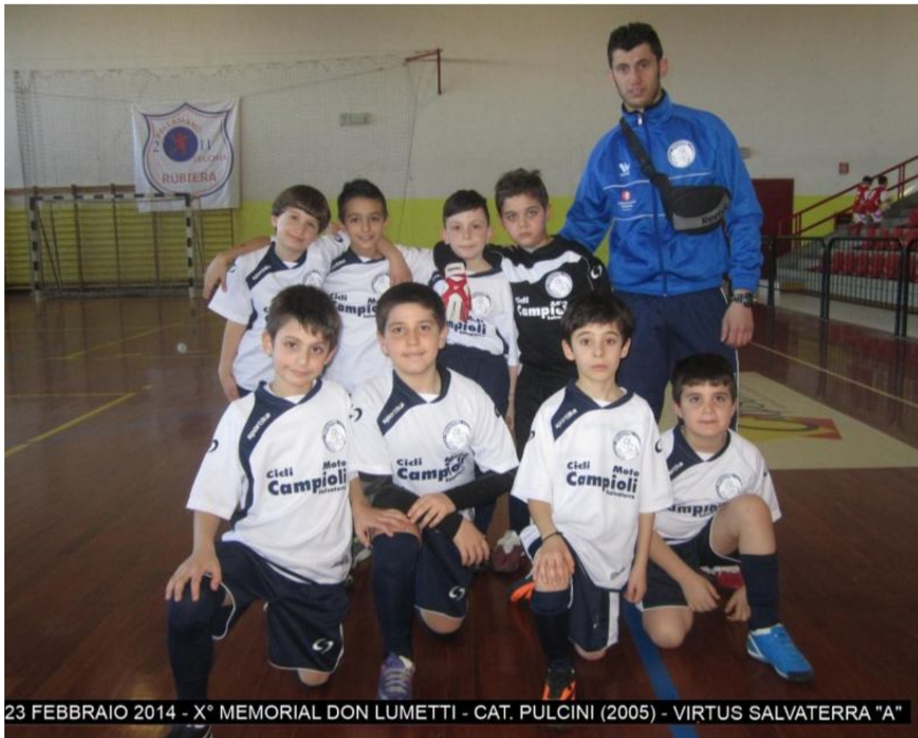
23 FEBBRAIO 2014 - X° MEMORIAL DON LUMETTI - CAT. PULCINI (2005) - VIRTUS SALVATERRA "A"