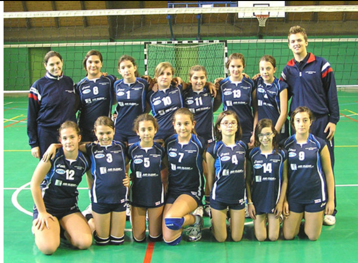
Le "studentesse" della formazione Under13

Abbiamo messo nero su bianco quello che come registratori spieghiamo durante gli allenamenti e così è nato il nostro primo compito in "palestra", rigorosamente a sorpresa, con esercizi di vario tipo che hanno svariato dai fondamentali di gioco (bagher, palleggio, ..), agli schemi, allo sviluppo di un riscaldamento alle regole comportamentali date in palestra.